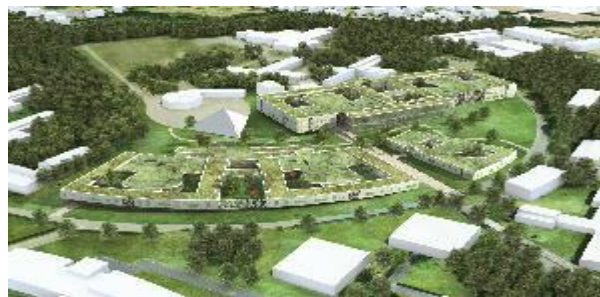
Etablissement Public de Santé Mentale de la Sarthe

L'Institut de formation en soins infirmiers est situé à l'intérieur de l'Etablissement Public de Santé Mentale de la Sarthe, sur le site d'ALLONNES, ville distante d'environ 7 km du centre de la ville du MANS et très bien desservie par un réseau d'autobus rapide (tempo).